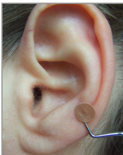
▲ Abb. 3.4.7

Sie gleiten mit dem Kugelstopfer über diesen Bereich, um sich für eine Stelle zu entscheiden.