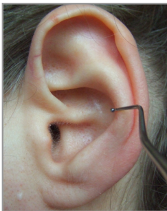
▲ Abb. 3.4.4 Kein Druck

Dazu drehen Sie den Kugelstopfer einfach um und nutzen das freie Ende zur Suche.