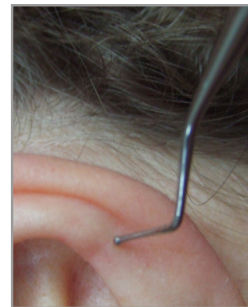
▲ Abb. 3.4.6 ... und Entscheidung

Hier wird der Kugelstopfer dazu verwendet, die postantitragale Furche zur Identifizierung der Lokalisation der Polsterzone aufzusuchen.