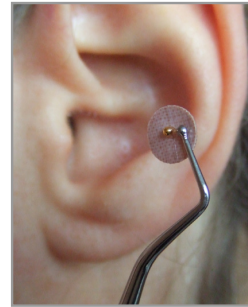
▲ Abb. 3.4.3 Mit dem Kugelstopfer nehmen Sie den Kleber mit dem Kugelchen auf und können nun zur Tatschreiten, nämlich den Punkt für diese Goldkugel am Ohr finden.

werden vom Streifen gelöst, indem der vorgestanzte Schlitz aufgeklappt wird. Damit wird die Klebefläche des Pflasters teilweise zugänglich.