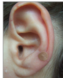
▲ Abb. 3.4.9

Mit dem Finger das Pflaster fixieren und den Kugelstopfer unter dem Finger hervorziehen.