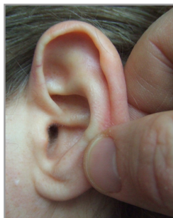
▲ Abb. 3.4.8

Das Goldkugelchen wird genau dort auf das Ohr aufgesetzt, wo Sie es hinhaben wollen.