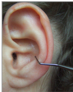
▲ Abb. 3.4.5

Beim Absuchen des Ohres keinen Druck ausüben, sondern nur das Gewicht des Kugelstoppers auf die Haut des Ohres auflegen und entlanggleiten.